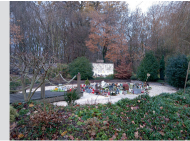
Streuweise am Haustierkrematorium Wesel

Ich überführe Ihr verstorbenes Tier in ein Haustierkrematorium zur Einäscherung, bei der nachweislich alle veterinärmedizinischen Vorschriften eingehalten werden. Durch Kenn-Nummern sind Verwechslungen ausgeschlossen.