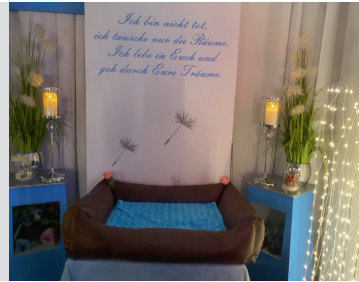
Abschiedsmöglichkeit in meinen Räumlichkeiten

Der würdevolle Umgang mit dem verstorbenen Tier ist mir ein besonderes Anliegen. Daher biete ich Ihnen und den trauernden Familienmitgliedern meinen vertrauenswürdigen Service, kompetente und individuelle Beratung und Ausführung sowie einen persönlichen Beistand an. Eine Tierbestattung ist weit mehr als nur Organisation. Der Abschied erinnert an ein ganzes Tierleben und formt Erinnerungen, die wir mit in die Zukunft nehmen. So ist es verständlich, dass eine Bestattung individuell gestaltet sein soll.